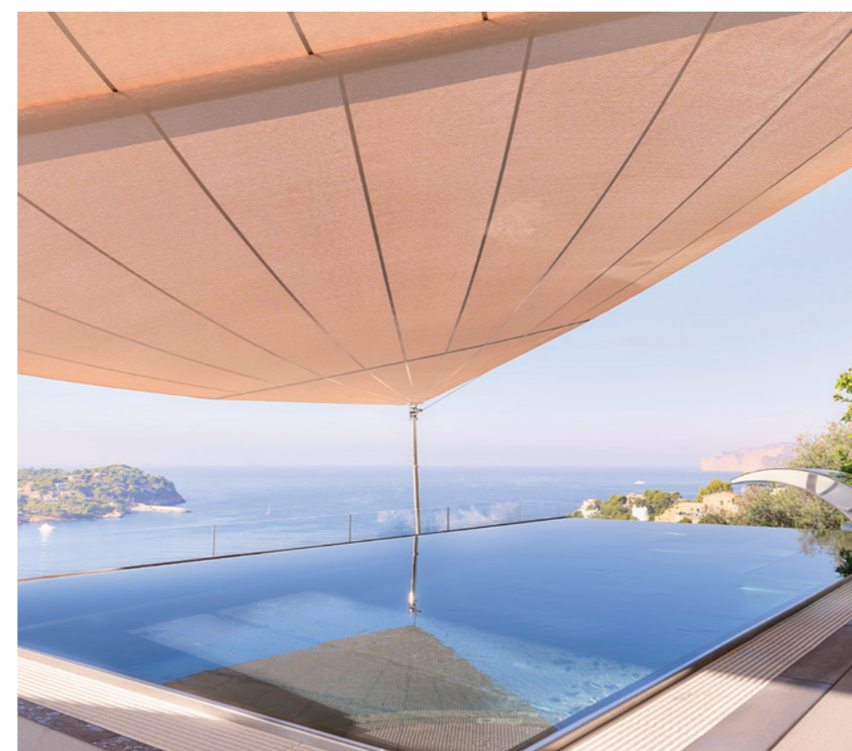
Bilder: © Oliver Brenneisen/project: Incompar Balear

Ein SunSquare-Sonnensegel steht somit nicht nur für hochfunktionale, wetterfeste Schattenlösungen, sondern auch für textile Architektur, die jedem Raum eine einzigartige und moderne Note verleiht – mit maximalem Komfort, minimalistischer Ästhetik und unübertroffener Qualität.