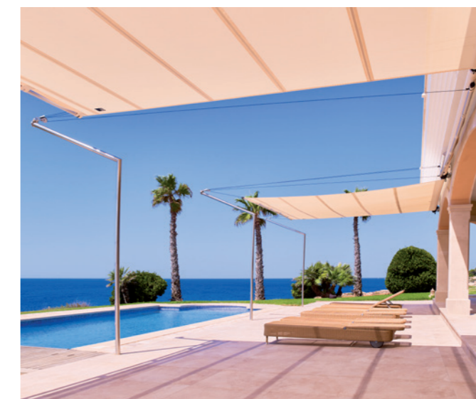
Auch rechteckige Sonnensegel-Zuschnitte werden bei SunSquare maßgeschneidert realisiert.

SunSquare sun sails guarantee pre-eminently functional, weatherproof shade through veritable textile architecture, striking a modern and unique note in any space, offering minimalistic aesthetics, maximum comfort and unbeatable quality. ☰