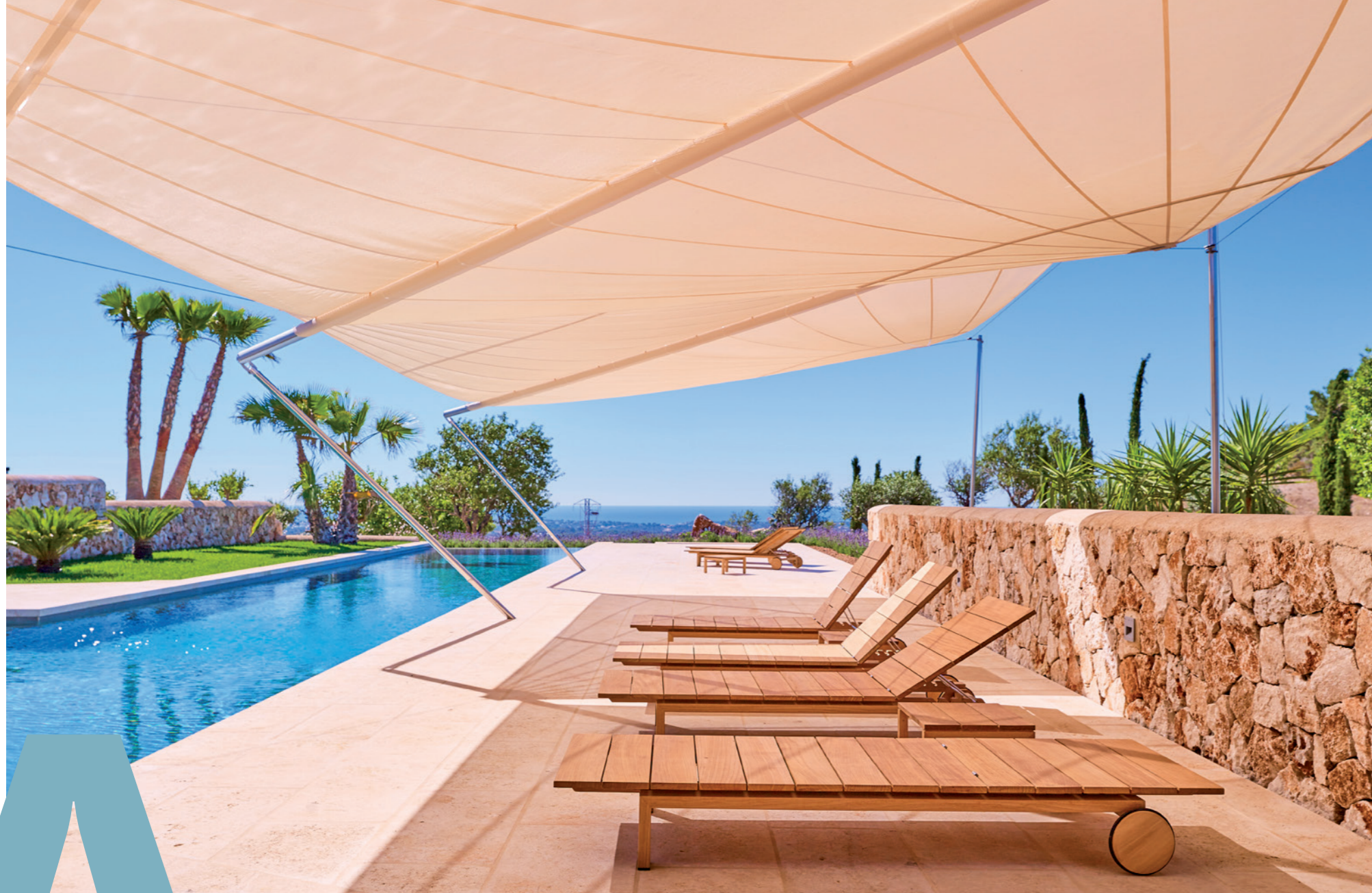
Individuell und präzise geplant: exklusive SunSquare-Sonnensegel. Hier ein Projekt auf Mallorca, das perfekt an die Umgebung angepasst wurde.